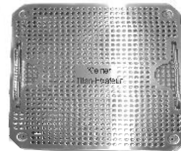
Siebschale, Lochblech mit Einteilung und Deckel Art.-Nr.: SO-700-301