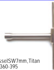
Steckschlüssel SW7 mm, Titan Art.-Nr.: SO-360-395