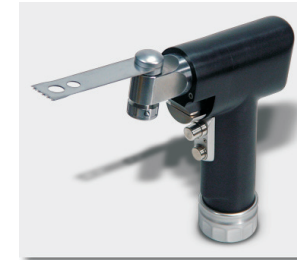
Saggital Säge 14-600-00 Saggital saw 14-600-00

Drehzahl/Speed: 0-1.000 U/min/0-1.000 r/min Max. Drehmoment/Max. torque: 7 Nm Gewicht /Weight: 800 G/1250 grams Arbeitsdruck/Pressure: min 6,5, max 10 bar Type gemäß Richtlinie/Type as guideline: EN 60601-1-2:1993 EN 60601-1-1990 + A1:1993 + A2:1995, MED UMW Schutzart nach DIN EN 529