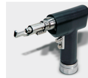
Sternum Säge 14-700-00 Sternum saw 14-700-00

Spannung/Voltage: 9,6 V, 12 V Drehzahl/Speed: 12 000 U/min / 14 000 U/min/ 12 000 r/min / 14 000 r/min Gewicht incl. Akku/Weight incl. Battery: 1100 g/1100 gr Motorleistung/Power: 150 Watt Regulierung/Regulation: stufenlos/Stepless Sägeblatt/Saw blade: Stryker Geräuschpegel/Noise level: 62 db