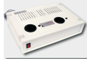
Akku / battery 9,6 V 2700 mAh 14-810-00