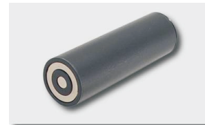
Akku / battery 12 V 2700 mAh 14-809-00