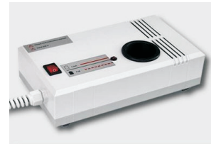
Ladegerät / Charger 2 Akkus / 2 batteries 14-816-00